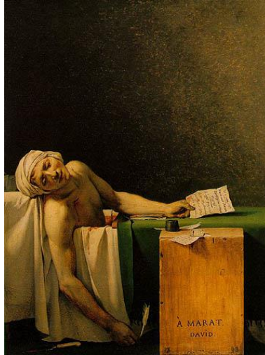
Imagem: A morte de Marat (1793), de Jacques-Louis David.