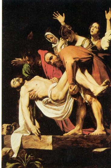
Figura: Deposição de Cristo (1603 – 04), Caravaggio.