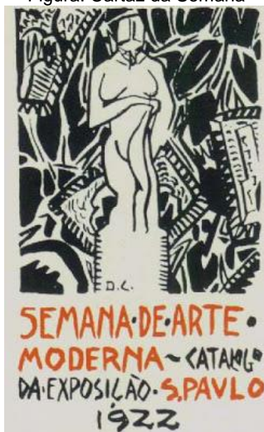
Figura: Cartaz da Semana