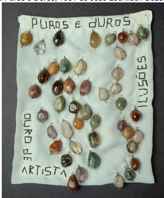
Figura: Puros e Duros, 1991 de José Leonilson Bezerra Dias