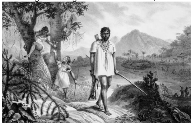
Imagem 1: Bugre de Santa Catarina, 1834