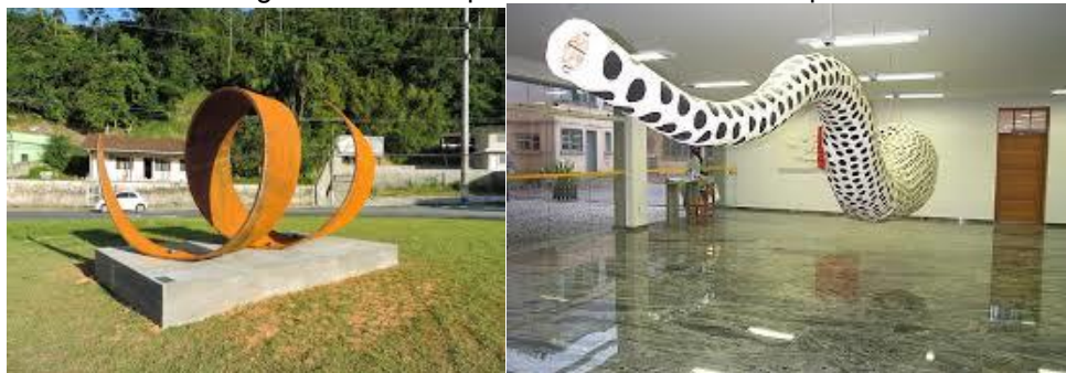
Figuras: “Cornucópia e embrião” e “Cornucópia