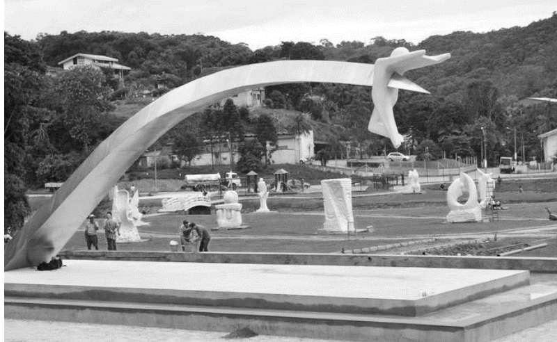
Figura: Parque das Esculturas de Brusque – escultura de Oscar Niemeyer.