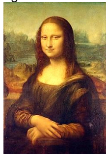
Figura: "Mona Lisa"