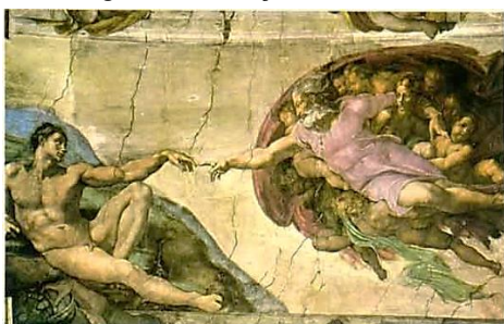
Figura: "A criação do Homem"