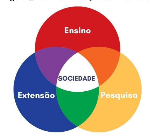
Figura 2 - Curricularização da Extensão

A inserção das atividades extensionistas no currículo tem como potencial promover o alinhamento da universidade com as demandas da sociedade, possibilitando uma aprendizagem transformadora, a formação de um cidadão crítico, capacitado para o mundo do trabalho e para lidar com os problemas reais presentes no contexto social. Além disso permite quebrar a segregação entre o ensino, pesquisa, extensão e questões da sociedade, conforme observamos na Figura 3Figura 2: