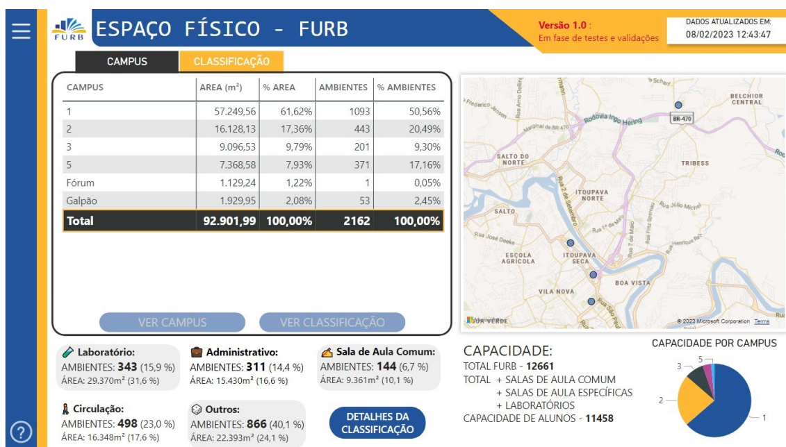
Figura 2: Painel – Espaço Físico – Página Inicial